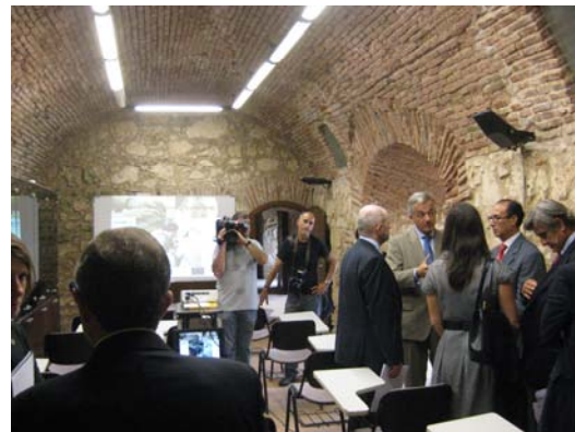
Escuela de Negocios. Visita del Comisario Samecki a las instalaciones