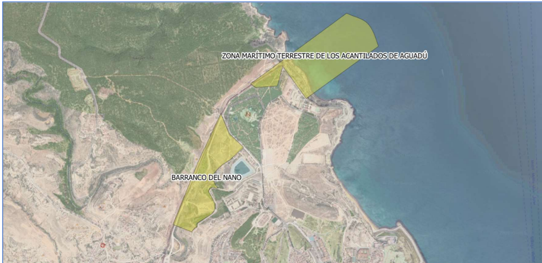
Ilustración 2. Detalle de ZECs.

Zonas de Especial Conservación (ZEC) Acantilados de Aguadú (ES6320001). Incluye la zona marítimo terrestre al norte de Melilla, ocupando la línea de costa acantilada que se prolonga hasta la punta del Cabo Tres Forcas en Marruecos. Se trata de un acantilado de aproximadamente 100 m. de altura, protegido por una plataforma de abrasión que forma la Punta de Rostrogordo y que provoca la existencia de fondos rocosos de gran valor ecológico con presencia de coralígeno mediterráneo hasta una profundidad de 20 metros.