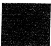
RGB 217 rojo 89 verde 0 azul