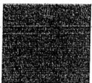
RGB 247 rojo 181 verde 18 azul