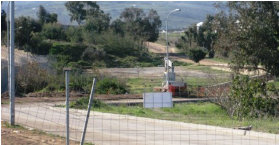
Carretera de la Purísima

El pozo de Alcaraz, situado en el callejón homónimo que comunica con la Carretera de Farhana, no se encuentra en la actualidad conectado con la red de impulsión principal de la Ciudad abasteciendo únicamente al entorno cercano.