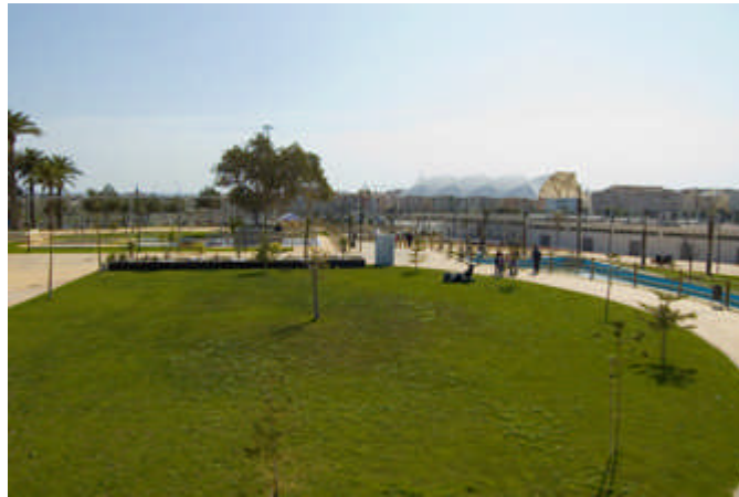
e) Jardines terapéuticos: 380 m2