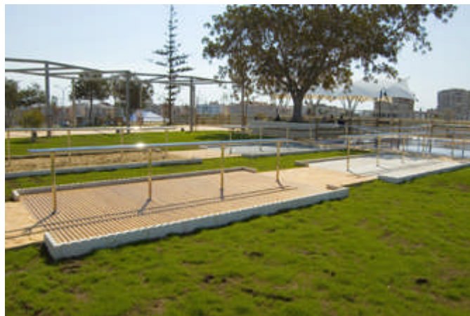
f) Zona de gimnasia suave a partir de los 60 años > 770 m2