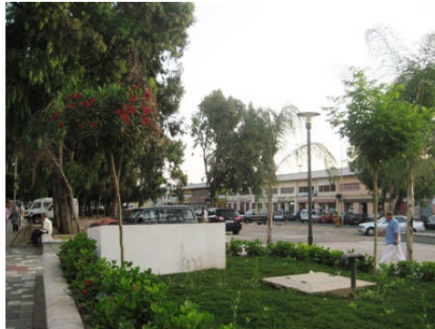
Zona de actuación